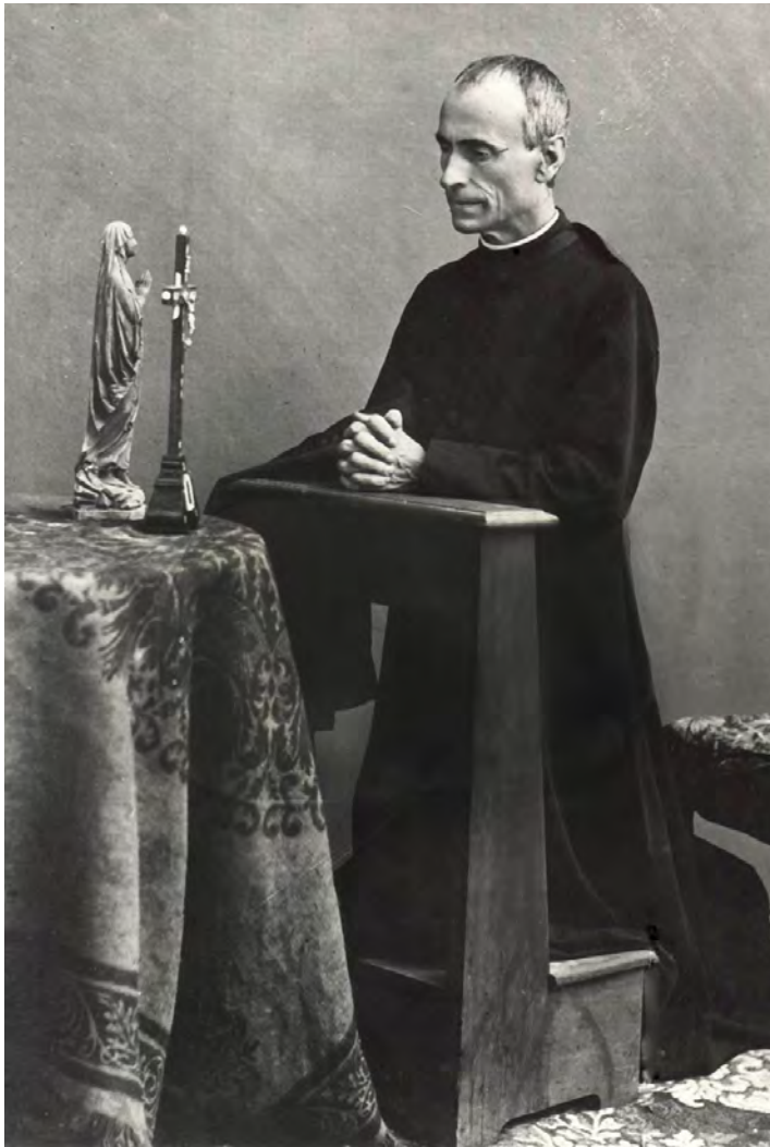
Don Rua arrodillado en oración.

particular. Mencionaremos algunas de las empresas de Don Bosco durante este período. (1) Necesitaba buscar fondos para la construcción de la Iglesia de María Auxiliadora en construcción desde 1863 y, finalmente, consagrada en 1868. Esto le requirió viajar por largos períodos de tiempo para visitar a sus benefactores fuera de Turín y el Piamonte. (2) De 1864 a 1874 recorrió el pedregoso camino de aprobación